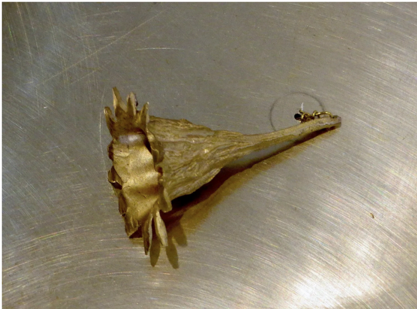
נטלי אילון ויפעת זיו, פרט מהתערוכה "יקום נולדי"

אנין במיוחד הוא פסל המחבר פרחי פורצלן זעירים, גבעול פליז ומשטח זכוכית כהה המעצימה את יופיים השברירי. מרהיבה גם חבצלת חוף גדולה יצוקה במתכת זהבית, שמעמקי גרונה הבהוק והמחורץ עולים צלילים יבשים כשל מונה גייגר או אותות מכוכב אחר.