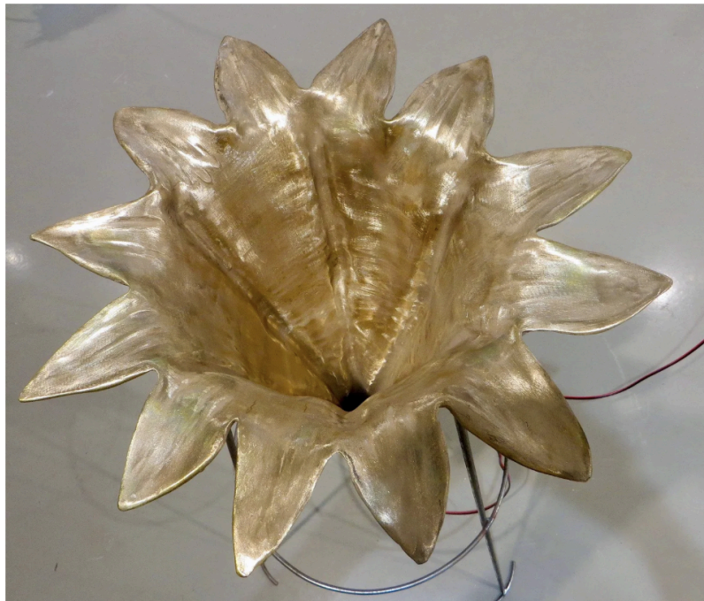
נסלי אילון ויפעת זיו, פרט מהתערוכה "יקום נולדי"

לפנינו פסלי חבצלות חוף הנושקות לשושנים הצחורים פרחי הבתולה (המלאך גבריאל מגיש שושן צחור למריה בבואו לבשר לה שתלד את בן האלוהים), המסתירים בצחור תומתם את סוד ההתעברות הנסית. ואמנם יש התעברות המתרחשת לא־מתרחשת בתערוכה כל העת בין הצלילים הזכריים לנרתיקי הפרחים הנקביים במקהלה של קולות וגופים רבים, דומים ושונים, המשוררים ביחד ולחוד.